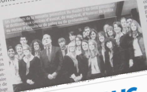
Les étudiants de la nouvelle promotion du master 2 de droit processuel se destinent aux carrières d'avocat, de magistrat, d'huissier de justice ou encore d'enquêteur de police ou de gendarmerie.